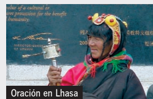
Oración en Lhasa

Salida en vuelo de regreso a Madrid, vía Doha. Llegada.