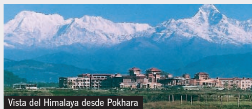
Vista del Himalaya desde Pokhara