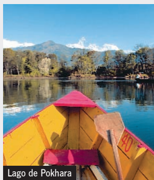
Lago de Pokhara

Desayuno. Salida por carretera hacia Pokhara, en ruta visitamos el Templo de Manokhama, al cual se accede en teleférico. Llegada a Pokhara.